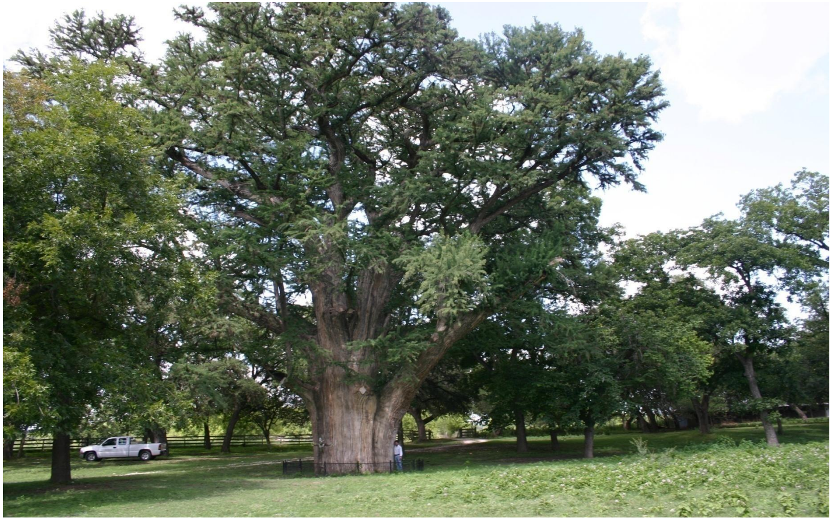
Ciprés – Taxodium distichum